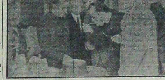
D. ministru Iasinschi (x) vizitând bucătăria cantinei dela Obor

Festivitatea s'a desfășurat în prezența d-lui ministru Iasinschi și a conducătorilor mișcării legionare